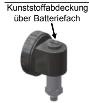
Abb. 1 Batteriefach